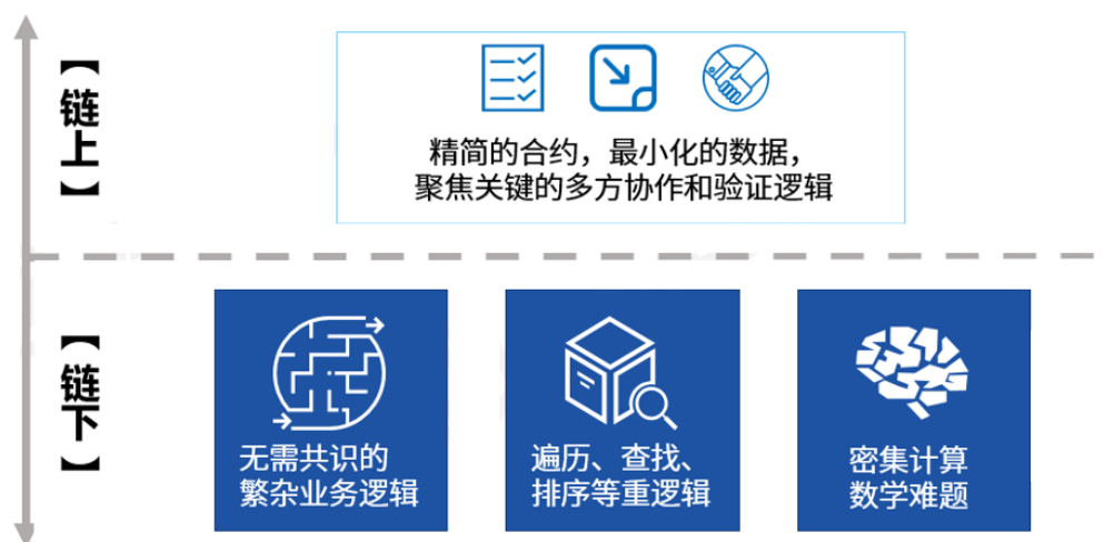
图 2 链上和链下智能合作逻辑

一些和密集计算有关的逻辑，尽量将其在链下实现，如复杂的加解密算法，设计成链下生成证明链上快速验证的逻辑；如果业务流程中牵涉对各种数据的遍历、排序和统计，则在链下建立索引，链上仅进行 Key-Value 的精准读写。